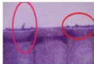
他社 → バリ発生