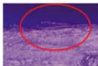
他社 → 側面の構造に損害がある