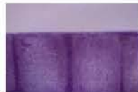
JMDA → バリなし