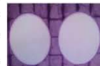
JMDA → バリなし