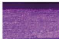
JMDA → ワーク構造損害なし