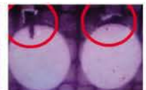
他社 → 磨耗発生