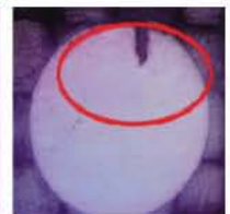
他社 → バリ発生